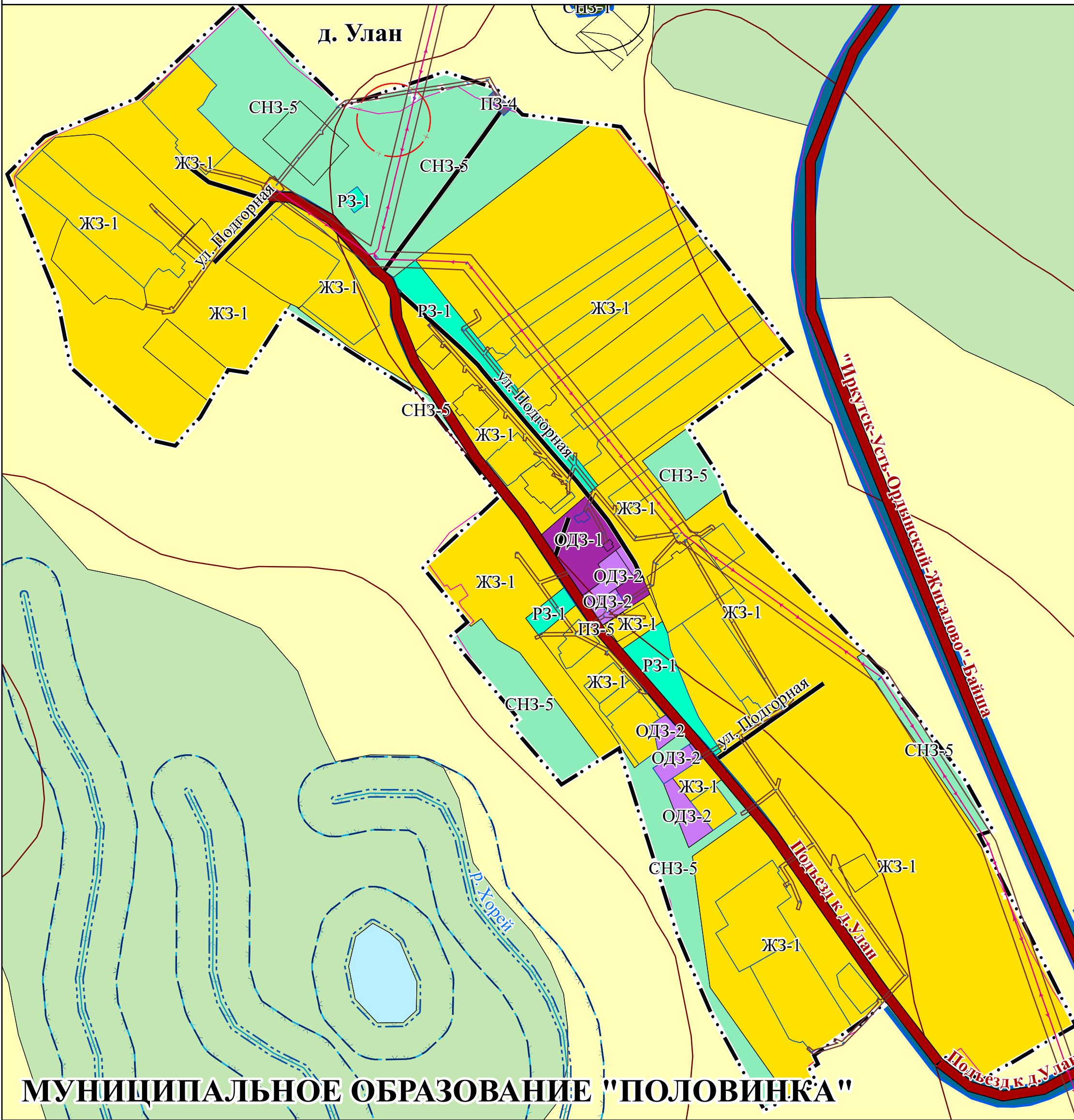
МУНИЦИПАЛЬНОЕ ОБРАЗОВАНИЕ "ПОЛОВИНКА"

УСЛОВНЫЕ ОБОЗНАЧЕНИЯ ГРАНИЦЫ СУБЪЕКТОВ РОССИЙСКОЙ ФЕДЕРАЦИИ, МУНИЦИПАЛЬНЫХ ОБРАЗОВАНИЙ, НАСЕЛЕННЫХ ПУНКТОВ ГРАНИЦЫ ЕДИНИЦ АДМИНИСТРАТИВНО-ТЕРРИТОРИАЛЬНОГО ДЕЛЕНИЯ РОССИЙСКОЙ ФЕДЕРАЦИИ